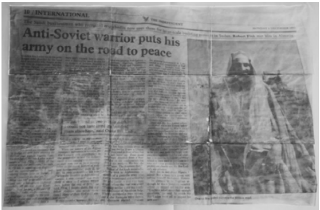
Detalle de Vaivén/ De la serie Prototipo Para Armar.