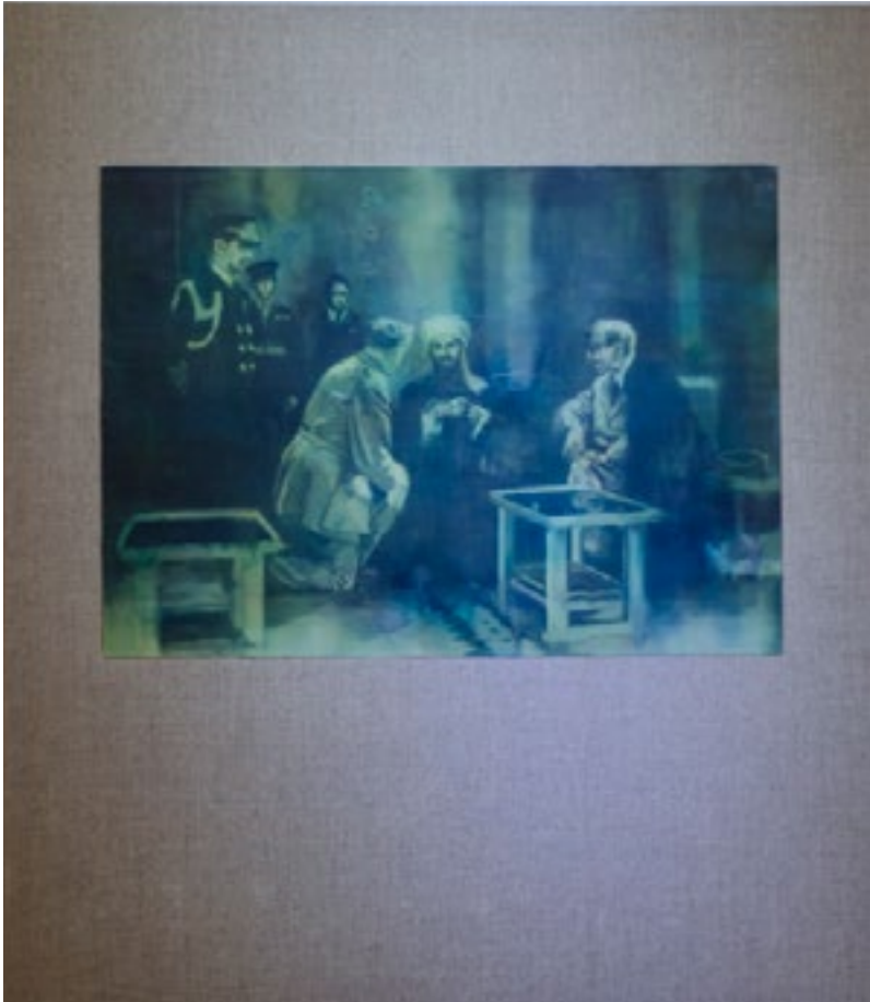
LA HERMANDAD / DE LA SERIE PROTOTIPO PARA ARMAR , 2016