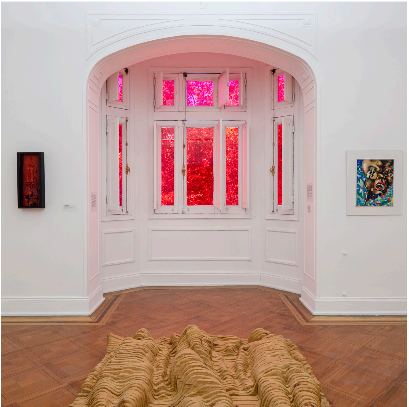
Museografía sala 10